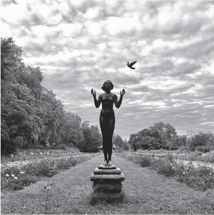
Bronzeplastik «Genesung» im Rosengarten Dresden