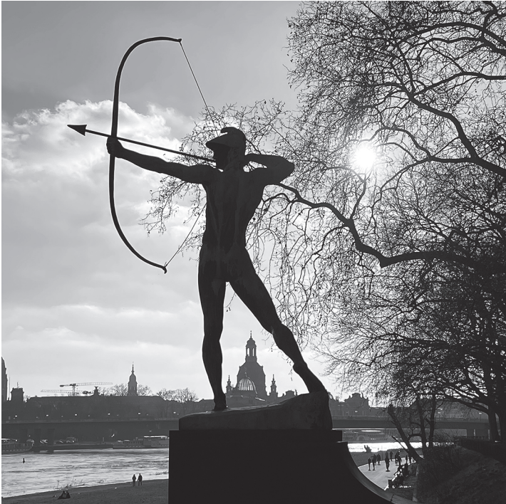
Dresden – im Zentrum das Wahrzeichen der Stadt: die wiederaufgebaute Frauenkirche und davor: der Bogenschütze am Neustädter Elbufer